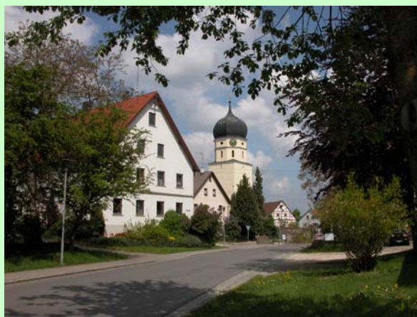
St. Ulrich Kirche in Neenstetten

Herausgegeben von der Gemeinde Neenstetten Stand : Februar 2005